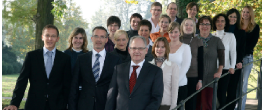
Das Team der B+A Treuhand AG: kompetent und effizient in der Abwicklung sämtlicher Dienstleistungen

Die B+A Treuhand AG in Cham ist langjähriger Branchenspezialist für Zahnärzte in der ganzen Schweiz und hat sich im Bereich der Praxisvermittlung und Coaching bei der Nachfolgeregelung einen Namen gemacht.