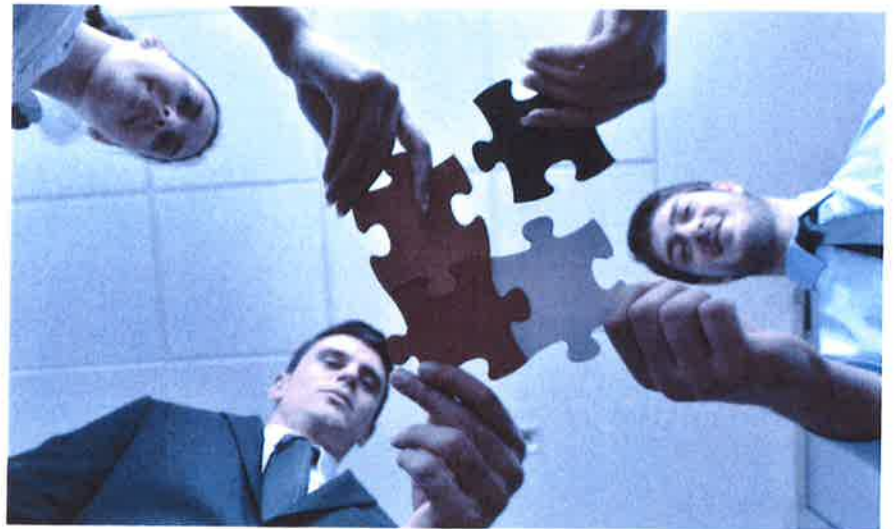
Bei gravierenden Pflichtverletzungen haften die Verwaltungsräte solidarisch. Jedes Mitglied kann für den vollen Schaden belangt werden.

«Eine sorgfältige Mandatsführung minimiert das Haftungsrisiko.»